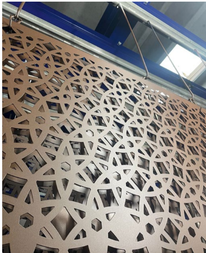
Der Lohnbeschichter bietet u.a. besondere Beschichtungsoptionen mit Spezial- und Sondereffekten an.

Bis 2019 wurde die Beschichtung der Metallbauteile an externe Lohnbeschichter vergeben. Aufgrund der anhaltend guten Auftragslage entschied sich die Geschäftsführung um Henryk Ott und Julian Jakubzyk 2019, die Beschichtung ins eigene Haus zu holen und sich damit auch als Lohnbeschichter aufzustellen.